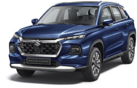
أزرق Celestial Blue (WBH)