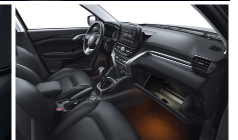
مصابيح للقدمين Footwell Lights