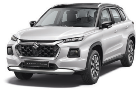
أبيض/أسود Arctic White/Black (C9J)