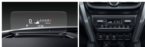
شاشة عرض أمامية Head-up Display