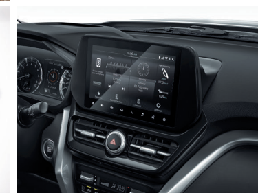
شاشة عرض 9 بوصة 9-inch Display Audio