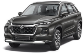
رمادي Grandeur Grey (WBF)