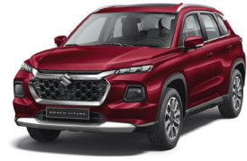
أحمر Opulent Red (WBG)