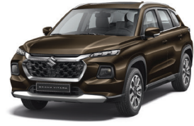
أسود Cave Black (ZQD)