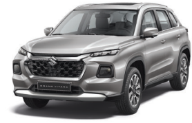
فضي Splendid Silver (WBE)