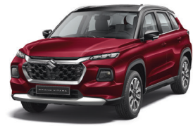
أحمر/أسود Opulent Red/Black (ESL)