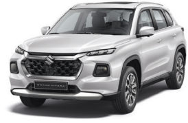
أبيض Arctic White (ZHJ)