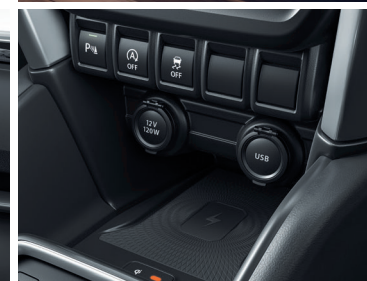
شاحن لاسلكي ومقابس USB Wireless Charger and USB Ports