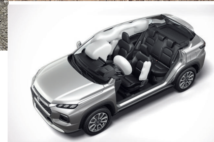
وسائد هوائية أمامية، جانبية وستائرية Front, Side and Curtain Airbags